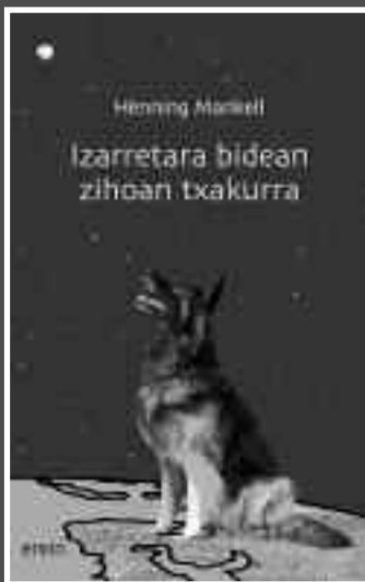
Izarretara bidean zihoan txakurra Henning Mankell Orr: 208 Urtea: 2001 ISBN: 84-7568-584-6