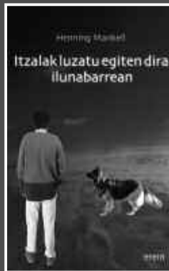
Itzalak luzatu egiten dira ilunabarrean Henning Mankell Orr: 216 Urtea: 2002 ISBN: 84-9746-073-1